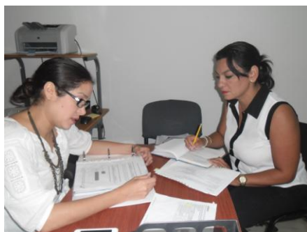
Centro de Información Electoral.