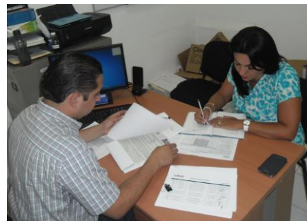
Unidad Técnica de Informática y Estadística.