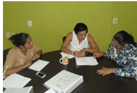
Dirección de Partidos Políticos.