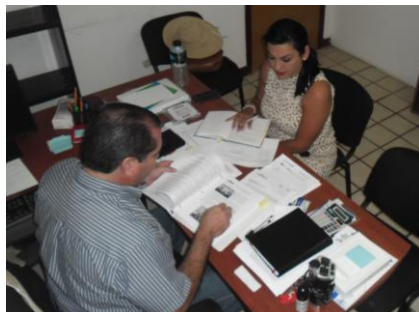
Dirección de Capacitación Electoral.