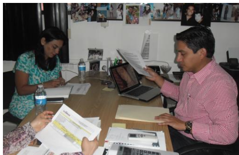
Dirección de Organización.

La evaluación programática de las actividades previstas para el primer trimestre del 2014, se concluyó con la visita de la subcontralora a las siguientes áreas: