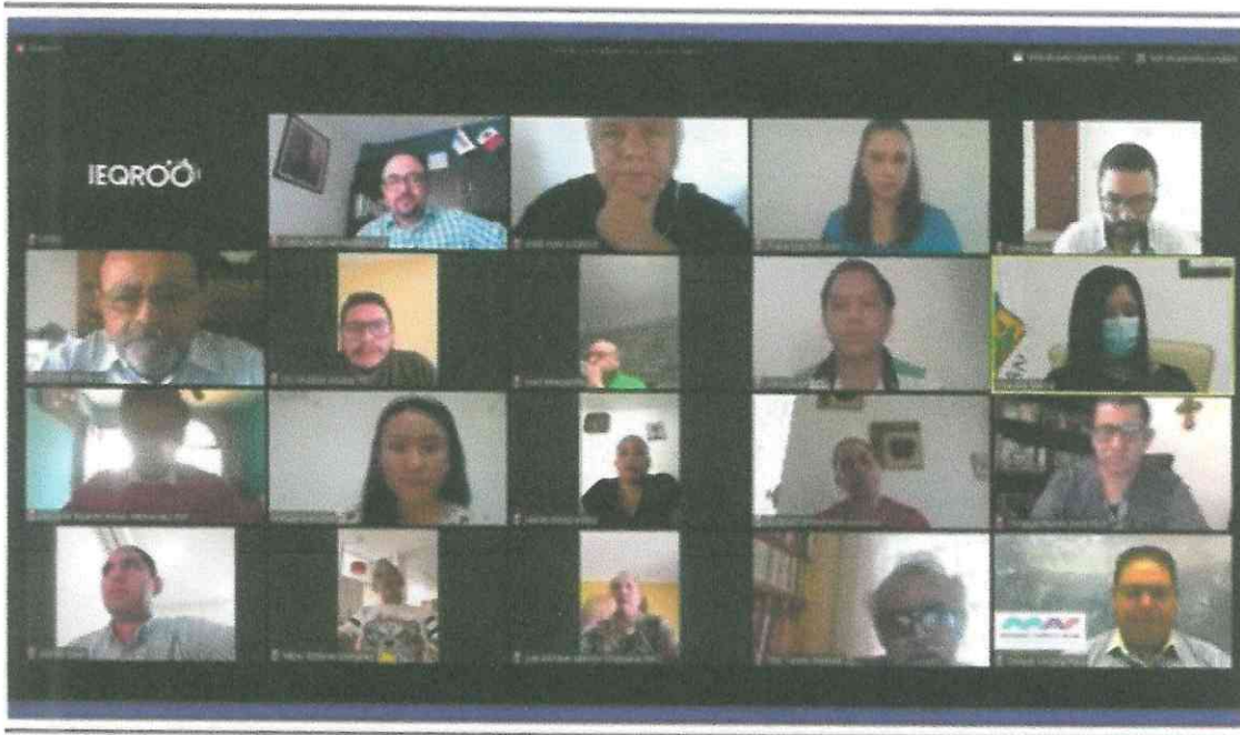
LA FOTOGRAFÍA QUE ANTECEDE PERTENECE AL ACTA DE LA SESIÓN EXTRAORDINARIA CON CARÁCTER DE URGENTE DEL CONSEJO GENERAL DEL INSTITUTO ELECTORAL DE QUINTANA ROO, CELEBRADA EL DÍA NUEVE DE ENERO DE DOS MIL VEINTIUNO A LAS DOCE HORAS.