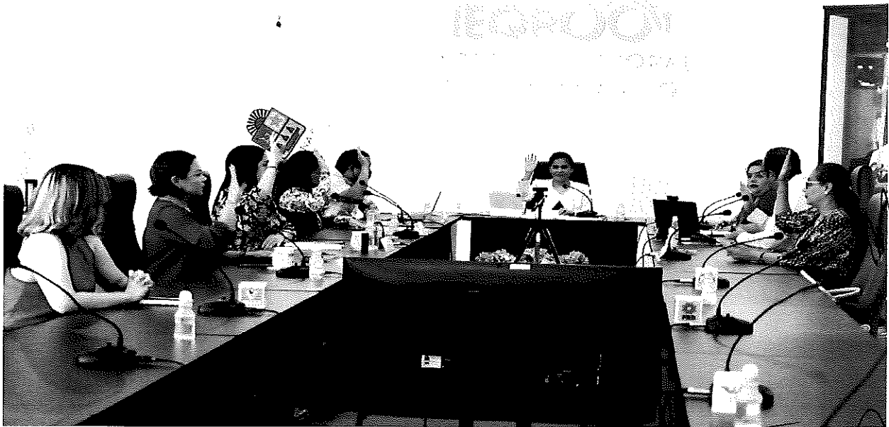
LAS FOTOGRAFÍA QUE ANTECEDE PERTENECE AL ACTA DE LA SESIÓN EXTRAORDINARIA DEL CONSEJO GENERAL DEL INSTITUTO ELECTORAL DE QUINTANA ROO, CELEBRADA EL DIA DIECISÉIS DE MAYO DE DOS MIL VEINTITRÉS A LAS ONCE HORAS.