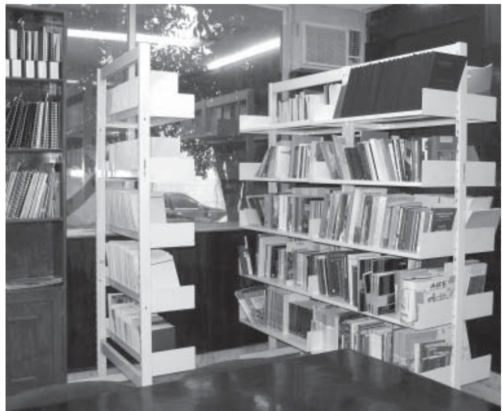
Cuadro 4. Total de servicios proporcionados por el Centro de Información Electoral por mes en el año 2004.