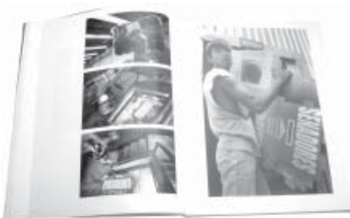
Cuadro 2. Total de adquisiciones del CIE a dos años de creación.

La Comisión Editorial se ha encargado de definir los lineamientos y criterios para la publicación de los documentos del Instituto, que fueron aprobados por el Consejo General.