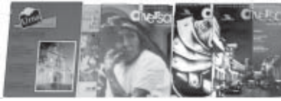
Cuadro 1. Incremento del acervo en el 2003