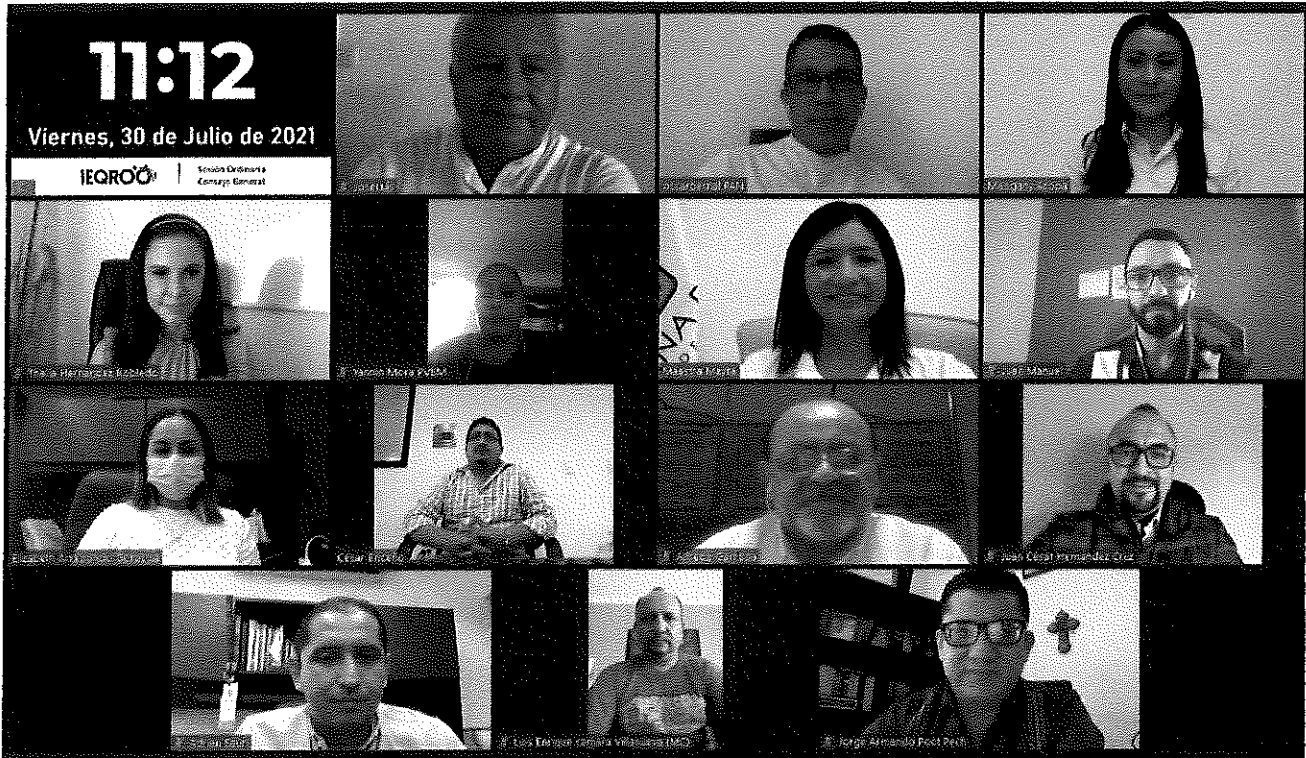
LA FOTOGRAFÍA QUE ANTECEDE PERTENECE AL ACTA DE LA SESIÓN ORDINARIA DEL CONSEJO GENERAL DEL INSTITUTO ELECTORAL DE QUINTANA ROO, CELEBRADA EL TREINTA DE JULIO DE DOS MIL VEINTIUNO A LAS ONCE HORAS