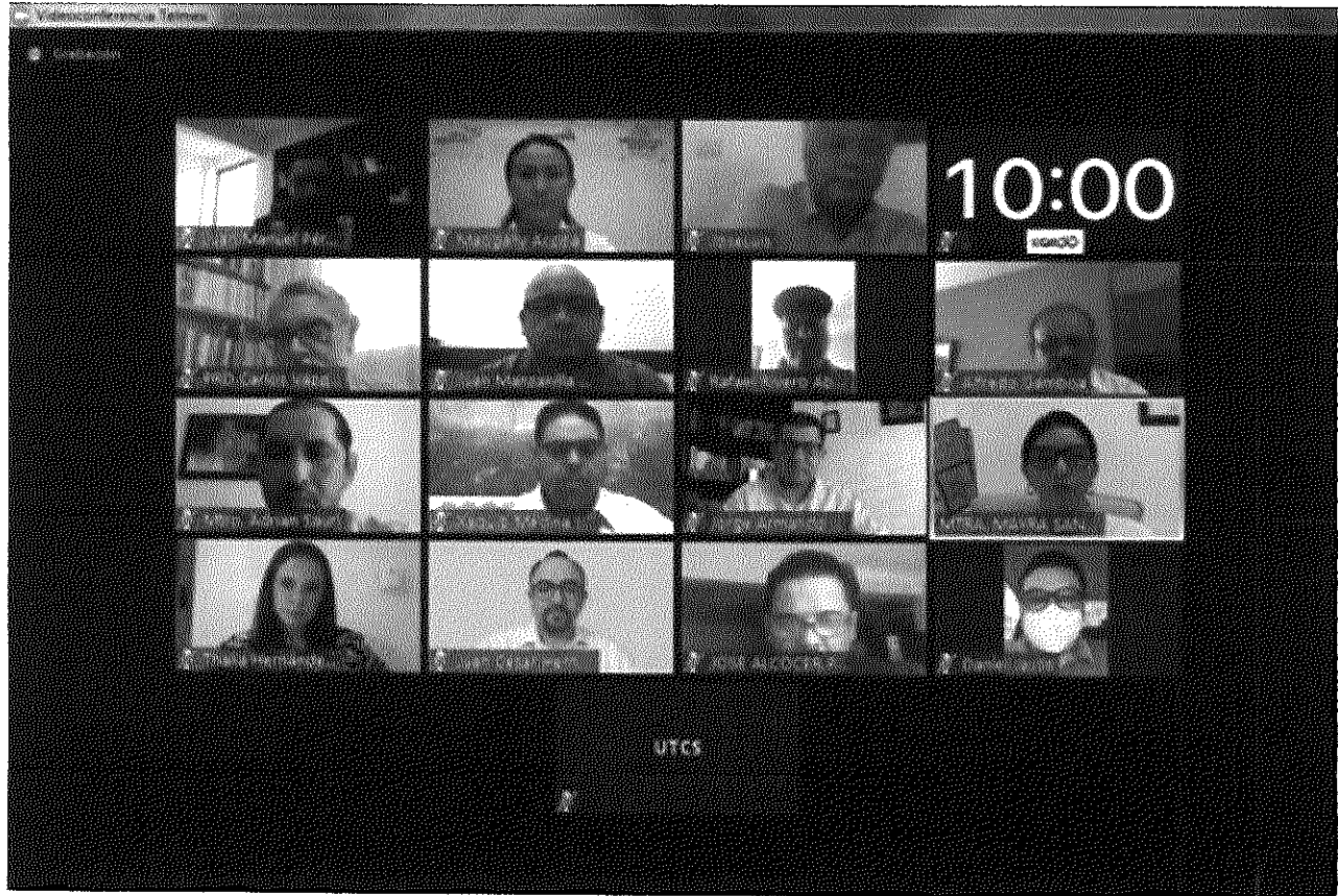
LA FOTOGRAFÍA QUE ANTECEDE PERTENECE AL ACTA DE LA SESIÓN ORDINARIA DEL CONSEJO GENERAL DEL INSTITUTO ELECTORAL DE QUINTANA ROO, CELEBRADA EL DÍA DIECISIETE DE JULIO DE DOS MIL VEINTE, A LAS DIEZ HORAS