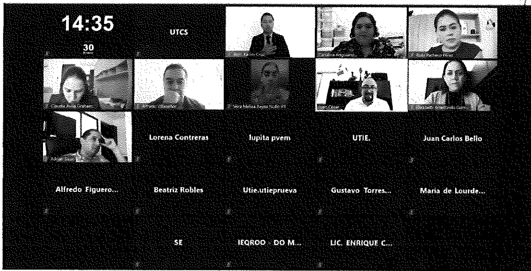
Consejo General del Instituto Electoral de Quintana Roo / Sesión Extraordinaria con carácter de urgente / 30 c

LA FOTOGRAFÍA QUE ANTECEDE PERTENECE AL ACTA DE LA SESIÓN EXTRAORDINARIA CON CARÁCTER DE URGENTE DEL CONSEJO GENERAL DEL INSTITUTO ELECTORAL DE QUINTANA ROO, CELEBRADA EL DÍA TREINTA DE ENERO DE DOS MIL VEINTICUATRO A LAS CATORCE HORAS CON TREINTA MINUTOS.