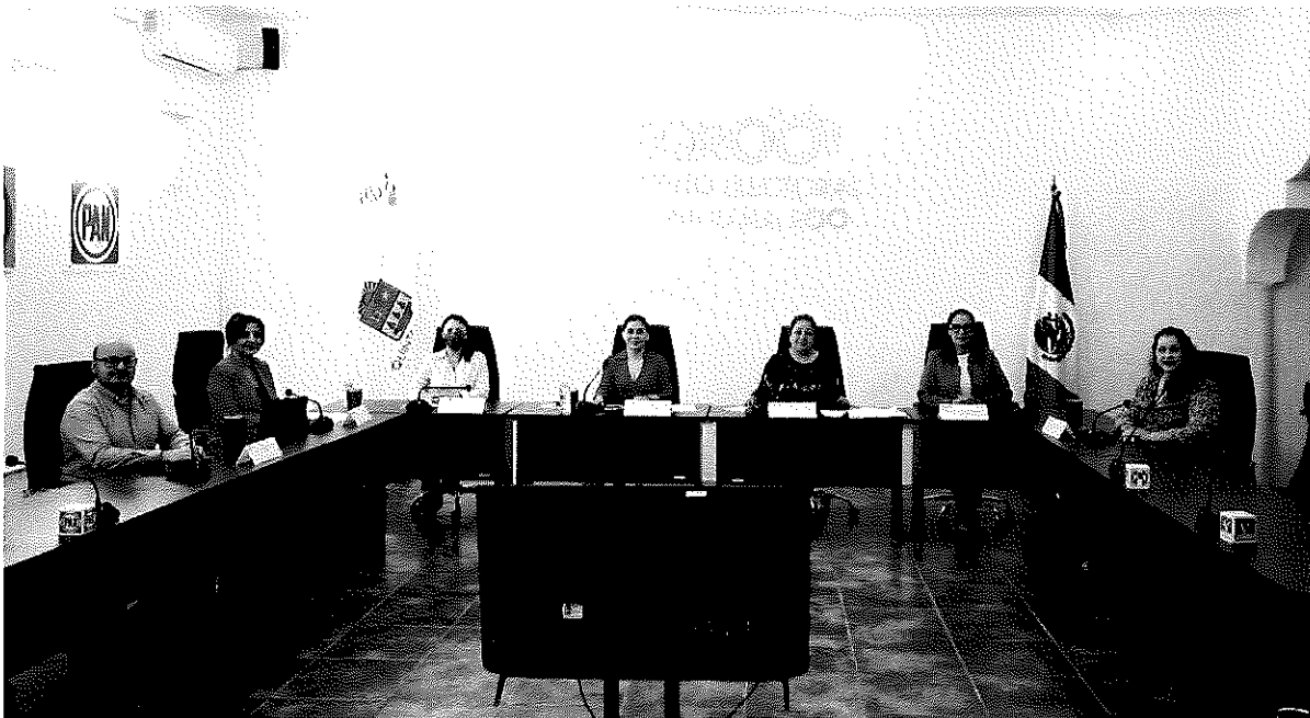
LA FOTOGRAFÍA QUE ANTECEDE PERTENECE AL ACTA DE LA SESIÓN ORDINARIA DEL CONSEJO GENERAL DEL INSTITUTO ELECTORAL DE QUINTANA ROO, CELEBRADA EL DÍA VEINTISÉIS DE FEBRERO DE DOS MIL VEINTISÉIS A LAS ONCE HORAS