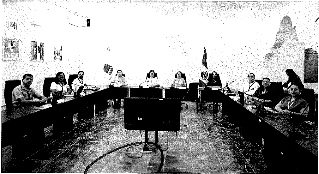
LA FOTOGRAFÍA QUE ANTECEDE CORRESPONDE AL ACTA DE LA SESIÓN EXTRAORDINARIA CON CARÁCTER DE URGENTE DE LA JUNTA GENERAL CELEBRADA EL DIEZ DE MARZO DEL AÑO DOS MIL VEINTISÉIS, A LAS DIEZ HORAS CON TREINTA MINUTOS.